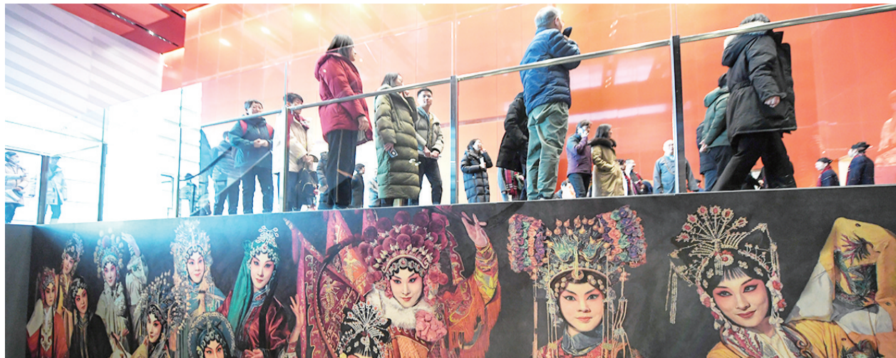
市民在北京艺术中心内参观

2023年12月底正式开放的北京城市副中心三大文化建筑已经成为市民游客观光打卡、沉浸式体验文化的新地标。