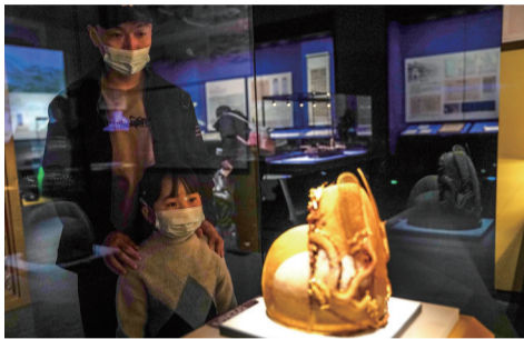
市民在北京大运河博物馆参观