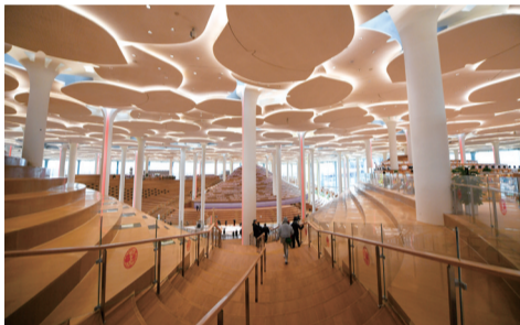
读者在北京城市图书馆内参观阅览