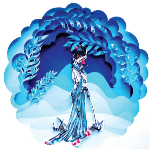
纸艺作品《黛玉葬花》