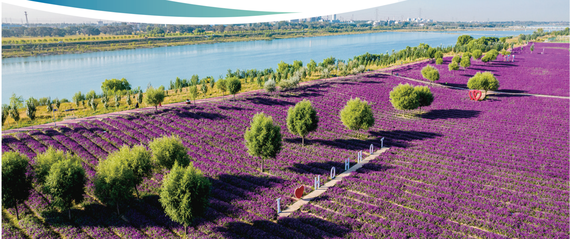
夏季的大黑河郊野公园