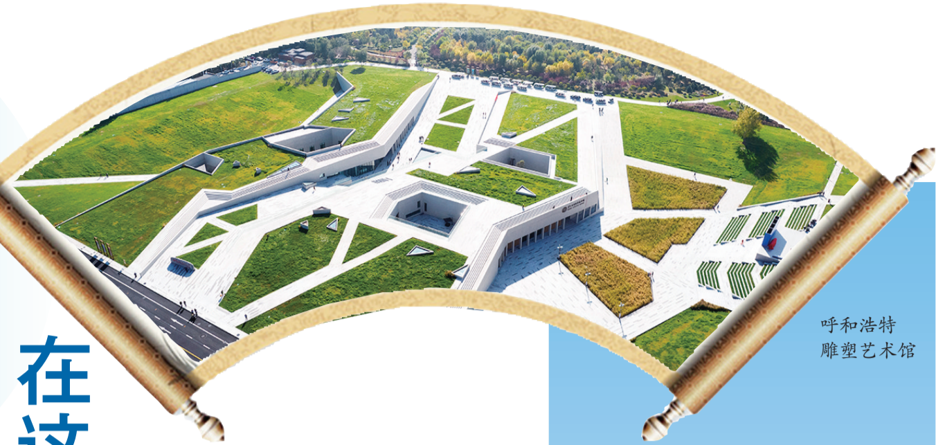
呼和浩特雕塑艺术馆