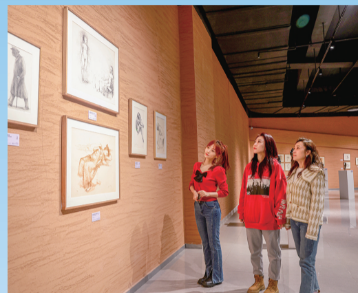
游客在呼和浩特雕塑艺术馆欣赏作品