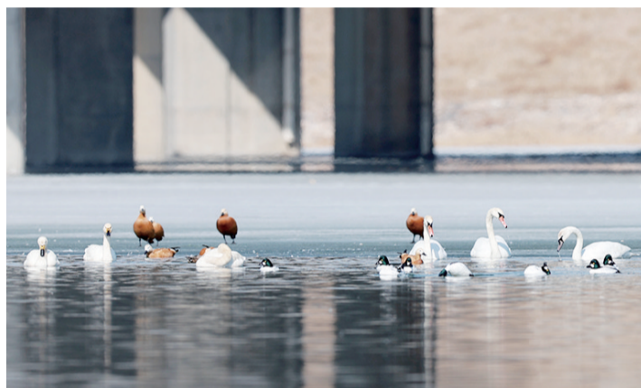
4只国家二级保护动物疣鼻天鹅首次来大黑河“做客”