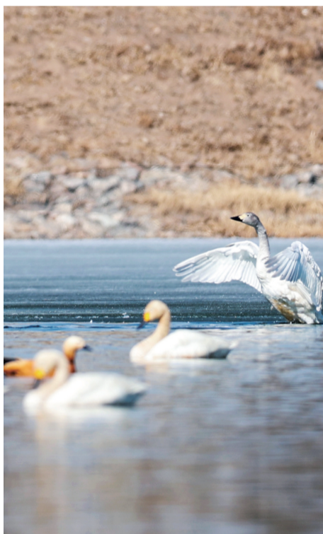
小天鹅在大黑河内戏水