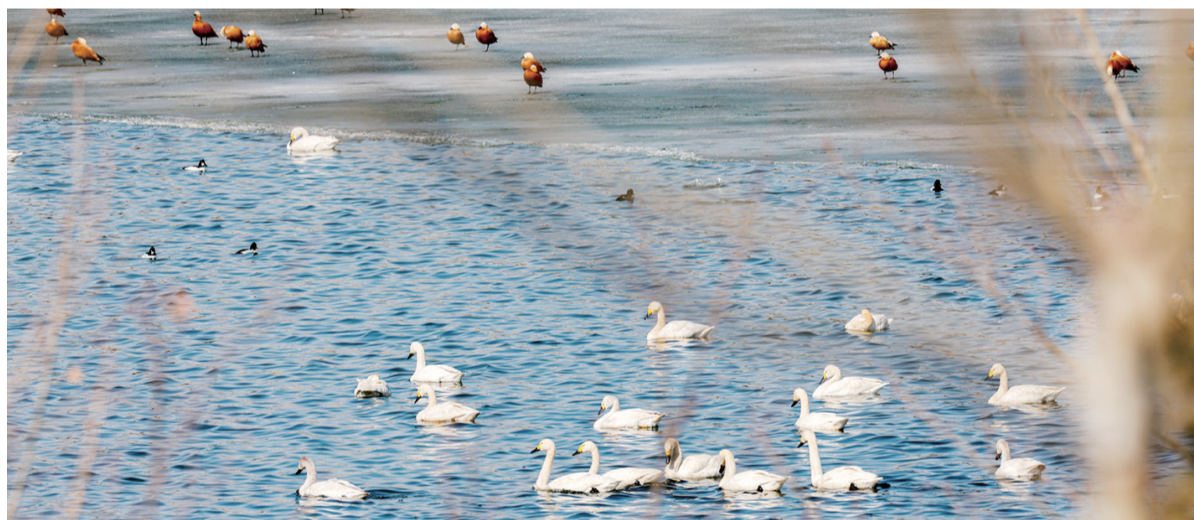
成群的天鹅到大黑河“做客”