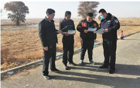
发动群众积极参与野生动物保护工作