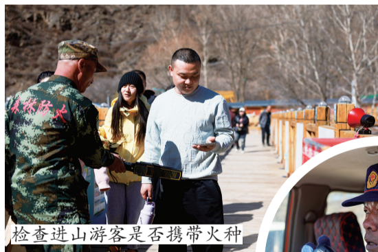
检查进山游客是否携带火种