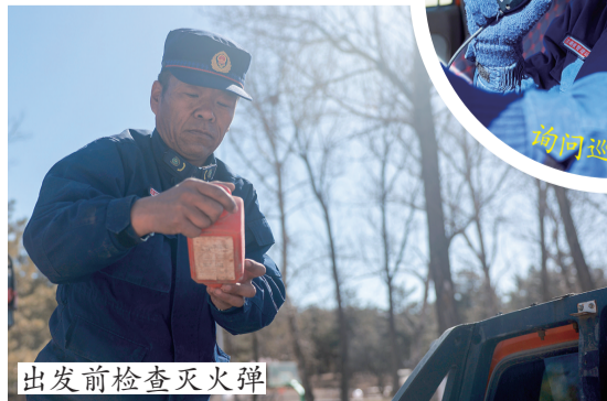
出发前检查灭火弹