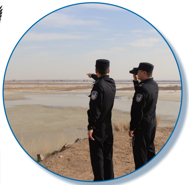
各警种各部门联动协作加强湿地日常监管