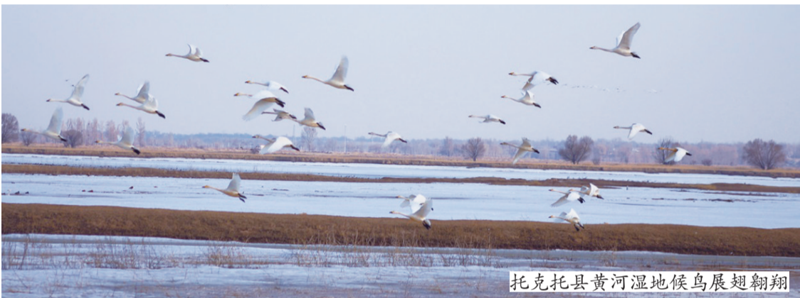
托克托县黄河湿地候鸟展翅翱翔

为守护这些可爱的“精灵”,给候鸟迁徙提供一个安全良好的栖息环境,托克托县公安局生态环境食品药品犯罪侦查大队和属地派出所的民警根据候鸟迁徙的特点,采取集中巡查、重点监控及空中无人机区域巡查等多种方式,对湿地及周边候鸟迁飞停歇地、集群活动区进行全天候动态监管,严防发生投毒、网捕、下套、猎捕等违法犯罪行为。期间,民警还深入辖区农贸市场、候鸟栖息地周边村庄广泛开展宣传活动,向群众普及野生动物保护方面的知识,发放《保护野生动物倡议书》,发动群众积极参与野生动物保护工作,及时救助受伤候鸟,举报猎捕候鸟的违法犯罪行为,增强广大群众思想认识和生态保护意识,营造浓厚的爱鸟、护鸟氛围,促进人与自然和谐共生。