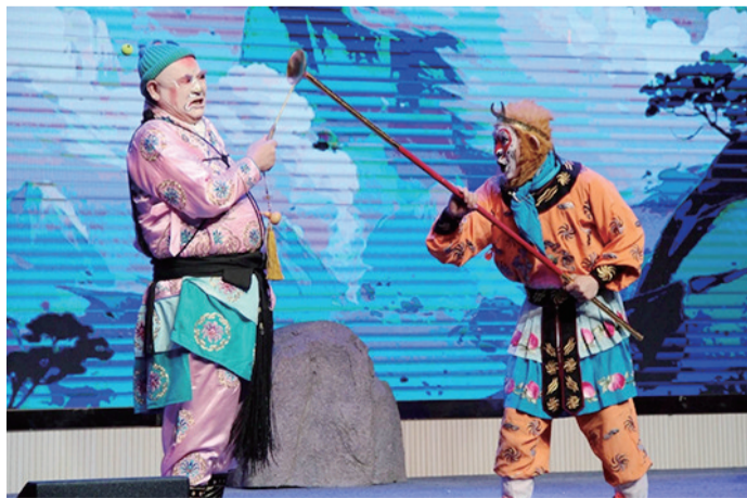
京剧演出让学生感受艺术魅力

校方表示,通过举办戏曲进校园活动,让学生们近距离接触戏曲文化,不仅可以感受到京剧艺术的魅力,还能激发学生们对中华优秀传统文化的兴趣,进一步增强他们的自豪感和文化自信。据了解,在系列活动中,内蒙古艺术剧院京剧团走进新城区满族小学、呼铁一中等学校开展富有特色的艺术活动,提升了学生们对高雅艺术的认知与鉴赏,传递积极健康的价值观、审美观和艺术观,为他们架起文化桥梁,让“北疆文化”丰富校园文化生活,润泽学生们的精神世界。