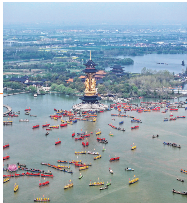
4月6日,参加完溱潼会船表演后的船只聚集在湖面上(无人机照片)。顾继红 摄