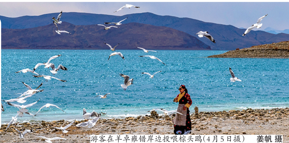
游客在羊卓雍错岸边投喂棕头鸥(4月5日摄)