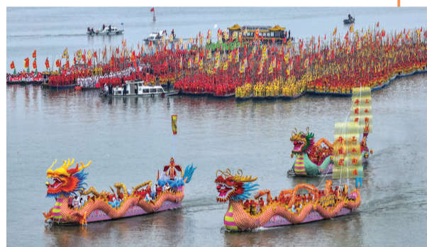
4月6日拍摄的溱潼会船现场(无人机照片)