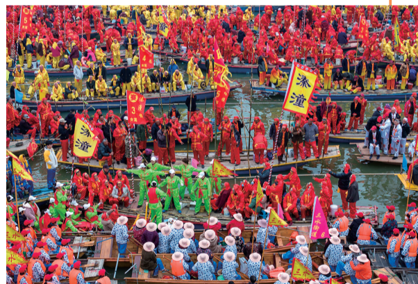
4月6日,参加会船表演的船只等待出发(无人机照片)。