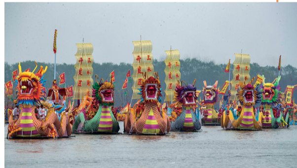
4月6日,人们参加会船舞龙表演。