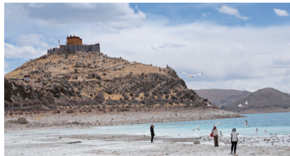
游客在喀庆拉山上以羊卓雍错为背景拍照(4月5日摄)