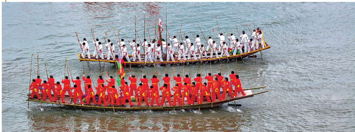
4月6日,会船选手们在溱湖撑篙奋力前行(无人机照片)。