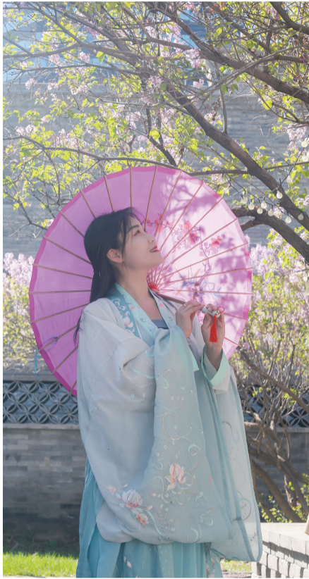
身穿汉服的游客在将军衙署博物院拍照