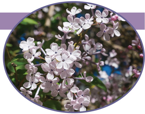
五瓣丁香,你找到了吗?