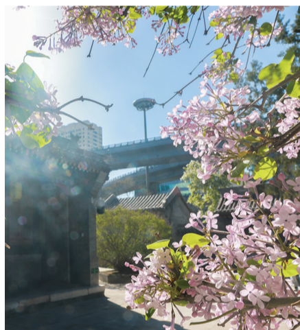
将军衙署博物院内树龄达180余年的国家三级丁香古树绽放