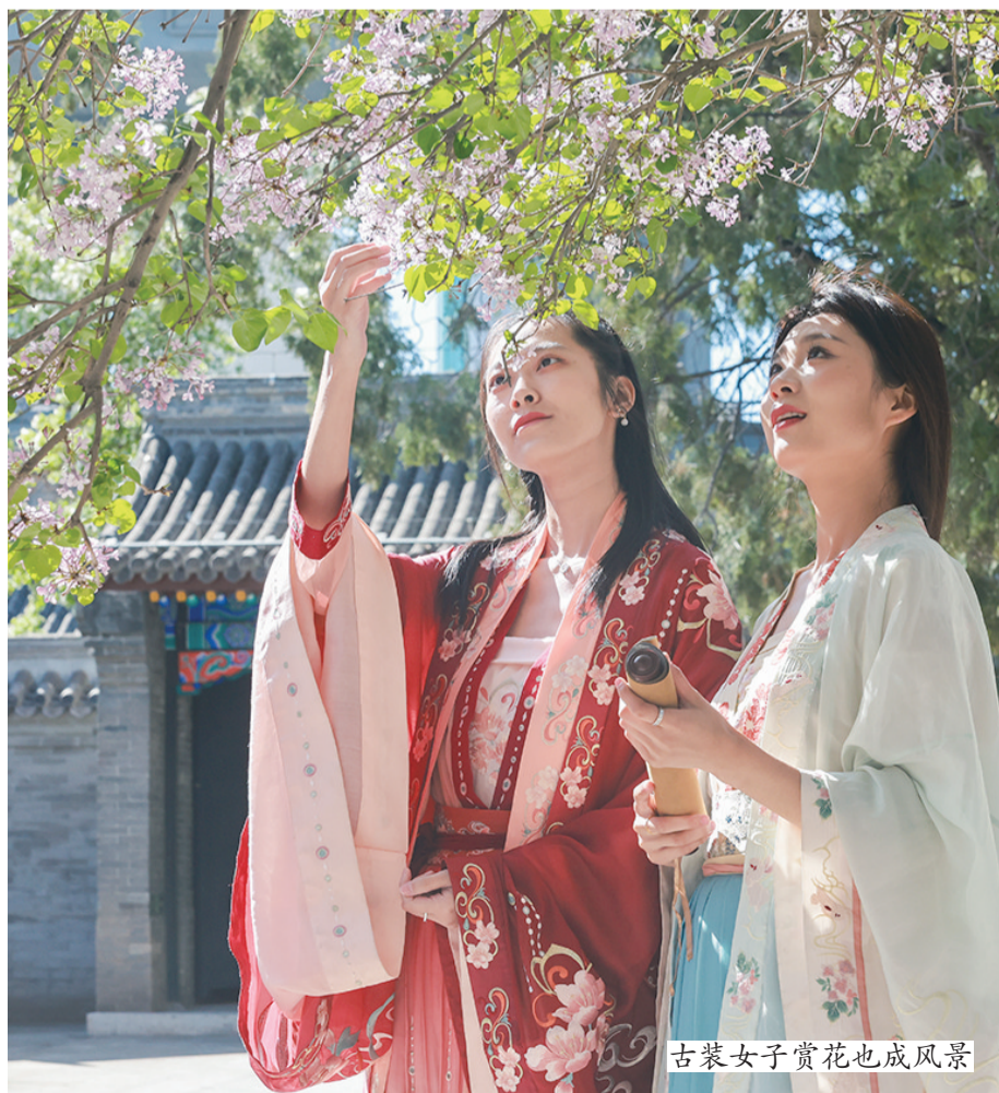
古装女子赏花也成风景