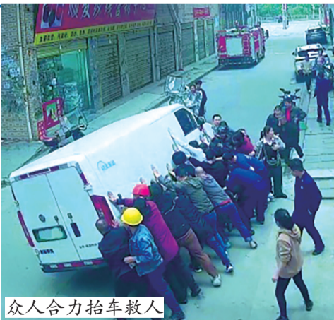
众人合力抬车救人

4月17日，记者从株洲荷塘区月塘街道办事处证实了该视频的真实性。目前，男孩病情趋于稳定，在医院做进一步治疗。