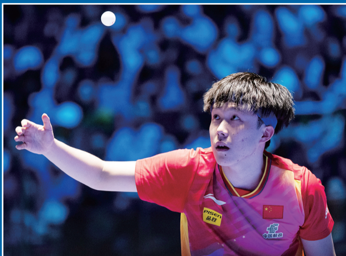
王楚钦在比赛中发球

随着2024澳门国际乒联世界杯18日进入淘汰赛，其赛制也恢复了传统的七局四胜制。在此前的小组赛中，打满四局，最后可能通过计算小分的新赛制也给中国国乒队员带来更多的刺激感。