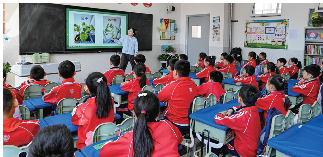
老师为学生讲解农作物品种分类