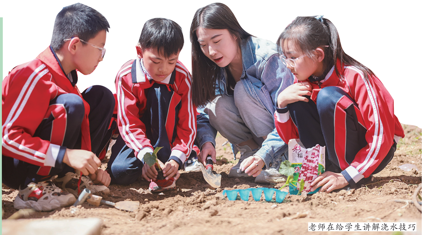
老师在给学生讲解浇水技巧

昨日,阳光明媚,首都师范大学呼和浩特实验小学的学生们在老师的带领下,正在忙碌地种植菜苗。该校积极落实国家“双减”政策,将劳动教育纳入课堂,开辟校园“开心农场”劳动实践基地,培养学生正确的劳动价值观、良好的劳动品质以及基础的劳动技能,教育引导学