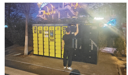
设置免费行李寄存柜