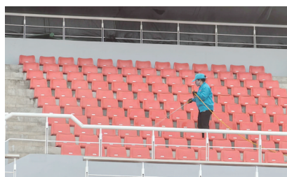
清洗体育场内座椅