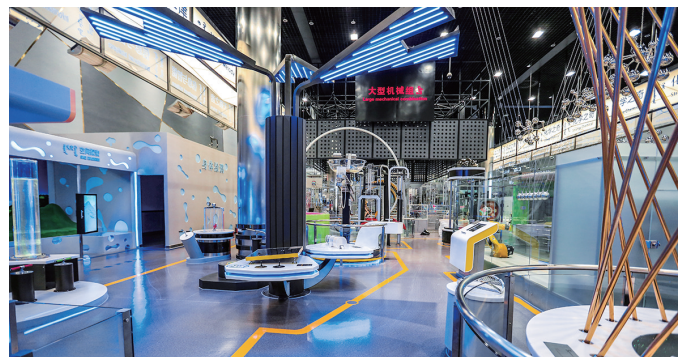
内蒙古科技馆内景