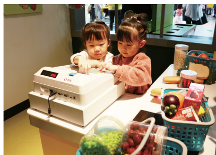
体验超市收银员工作