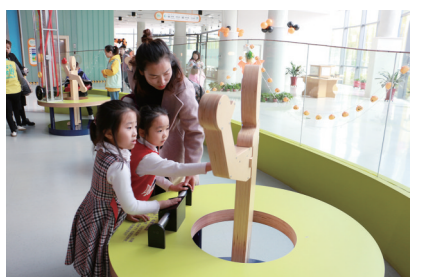
探索血液循环系统