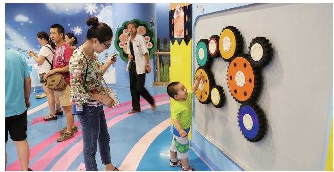
体验连锁反应展品