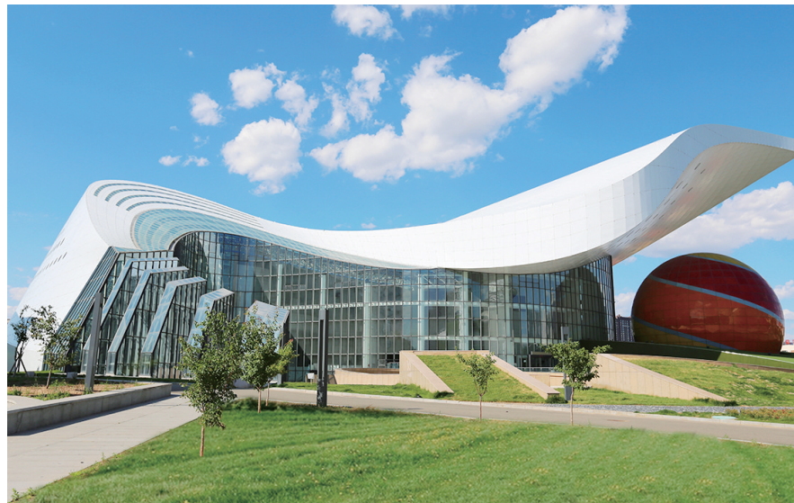
内蒙古科技馆