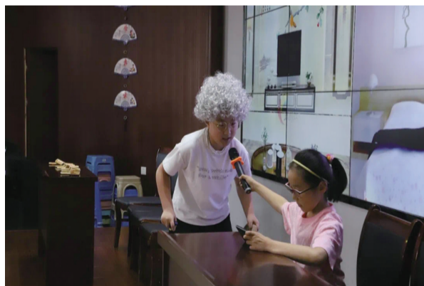
学生正在进行心理剧演出

青少年要拥有一个健康的心理状态,离不开家长、学校的共同努力。在首府中小学的日常工作中,也会针对家长进行一些相关的主题讲座、培训,让家长更懂孩子,为他们的心理健康成长营造更温馨、更有爱的家庭环境。5月是心理健康月,形式多样且内容丰富的活动在校园里开展,为学生心理健康提供有力的支撑。