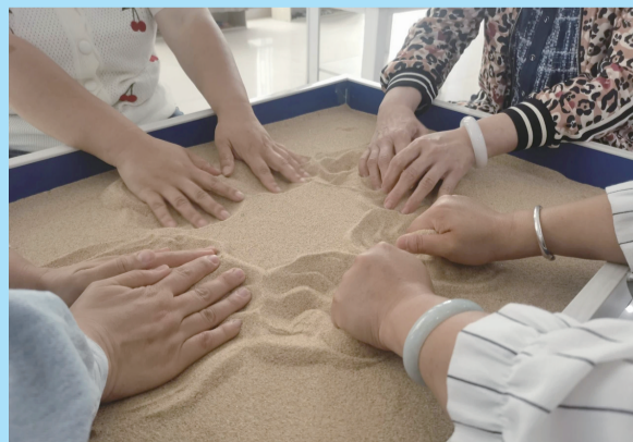
家长体验沙盘游戏