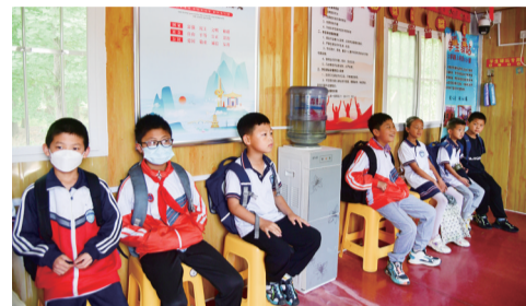
5月21日,在莱芜区高庄街道圣水庵村“学生驿站”,村里的小学生在候车。