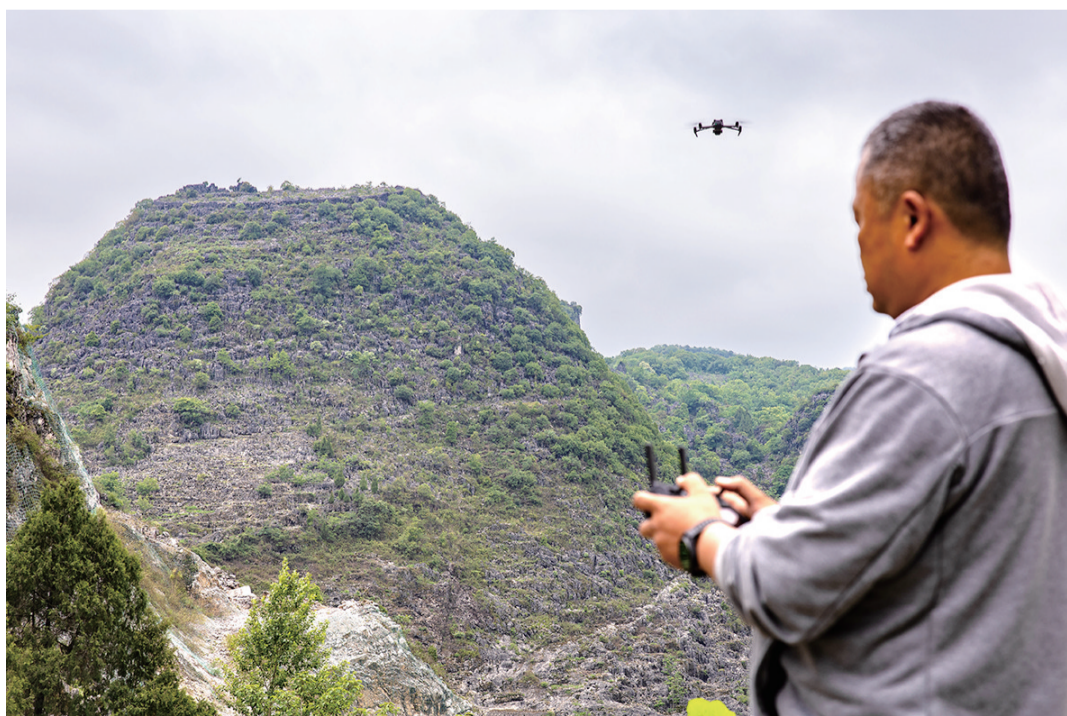
当地一名文物保护工作者在卢家营附近航拍