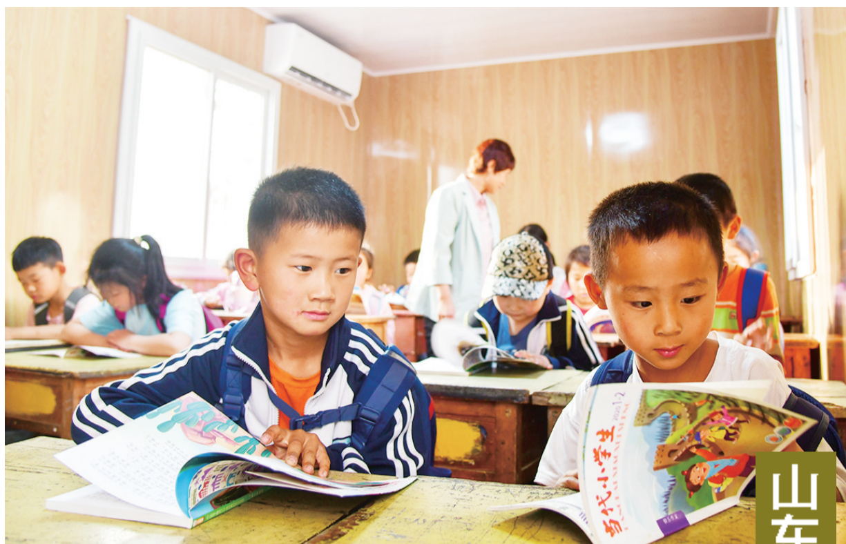
5月20日,在莱芜区雪野街道黑山村“学生驿站”,放学后的小学生阅读课外书籍等候家长。