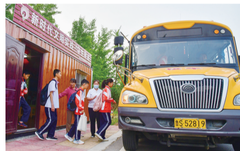
5月21日,在莱芜区高庄街道圣水庵村“学生驿站”,村里的小学生排队登车上学。