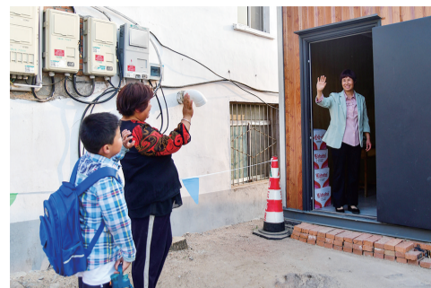
5月20日,在莱芜区雪野街道黑山村“学生驿站”,家长接到学生后向公益管理员告别。