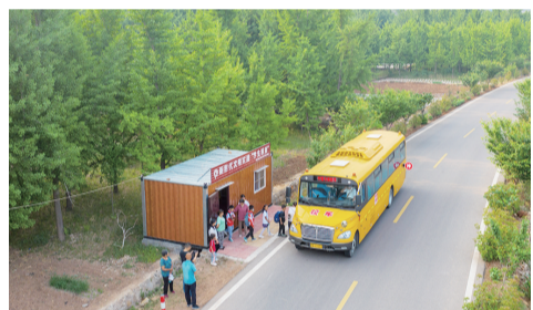
5月21日,在莱芜区高庄街道圣水庵村“学生驿站”,小学生排队登车。