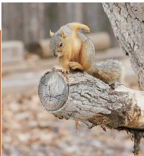
超级英雄般的姿势