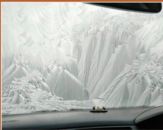
汽车挡风玻璃结了冰