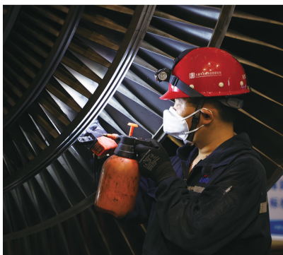
为汽轮机叶片进行金属试验