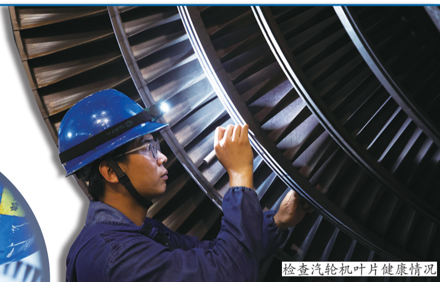
检查汽轮机叶片健康情况