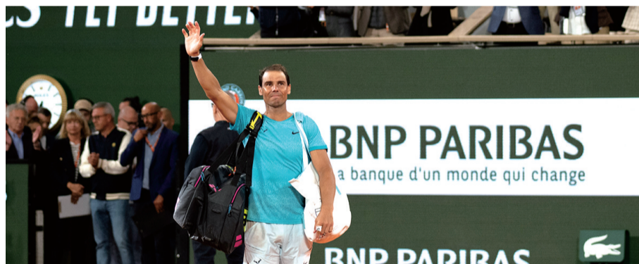
纳达尔在比赛后向球迷致意