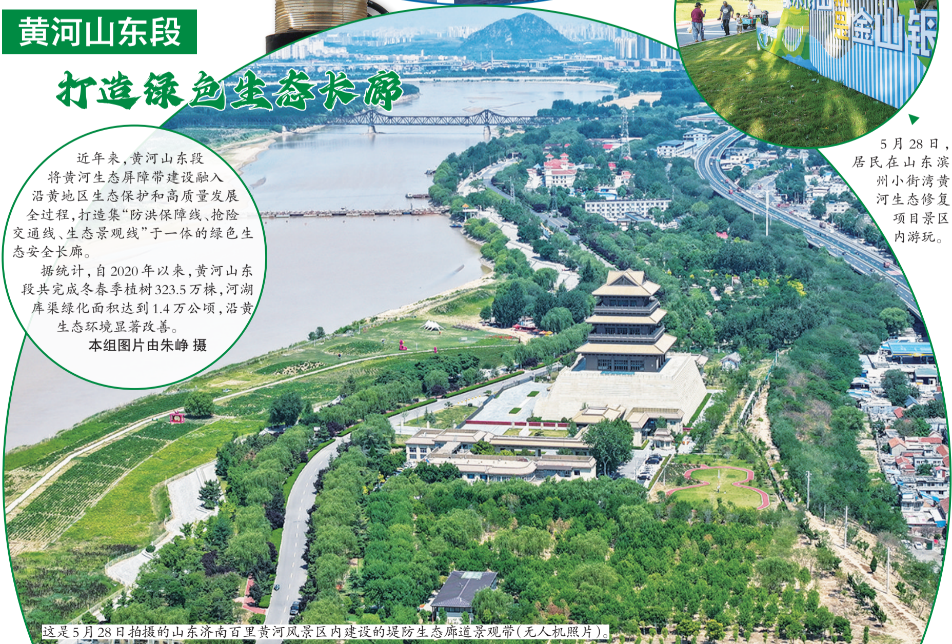
这是5月28日拍摄的山东济南百里黄河风景区内建设的堤防生态廊道景观带(无人机照片)。