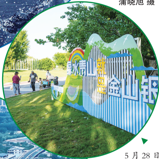
5月28日,居民在山东滨州小街湾黄河生态修复项目景区内游玩。