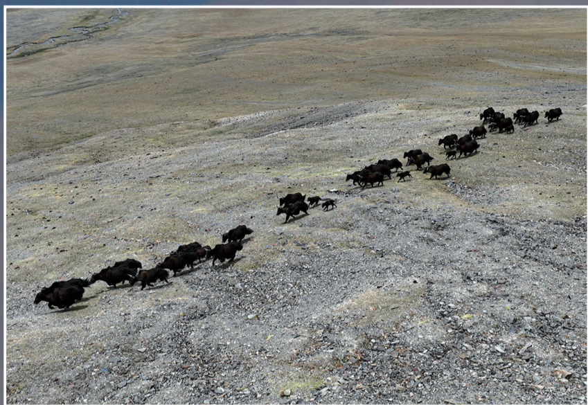
这是在那曲市尼玛县拍摄的野牦牛群,其中有刚出生不久的小牛犊。