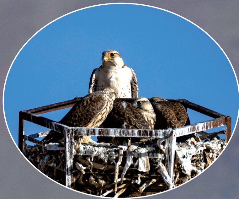
这是在那曲市尼玛县拍摄的养育雏鸟的游隼,它们在“无人区”中林草部门树立的“鹰架”上营巢。