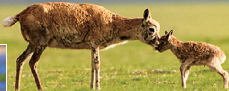
这是在那曲市申扎县拍摄的藏羚羊

6月的羌塘草原,藏羚羊、黑颈鹤、野牦牛、游隼等野生动物幼崽纷纷出生,牦牛等家畜也处在育幼期,羌塘草原生机勃勃,孕育着新希望。