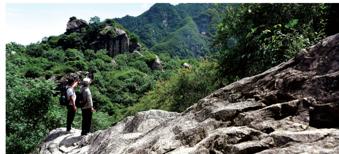
陕西省西安市翠华山景区,游客在崩塌石海游览拍照。