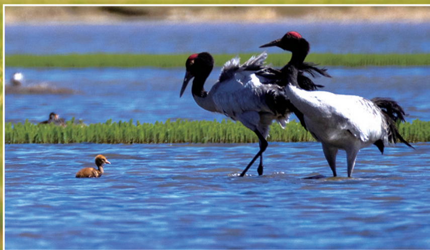
这是在那曲市申扎县拍摄的养育雏鸟的黑颈鹤