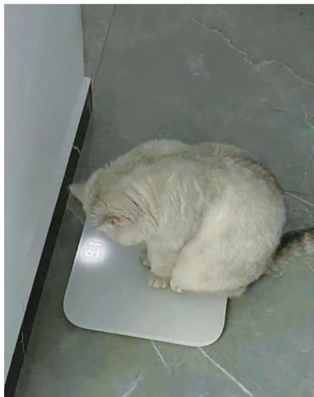
数字应该能让它反省