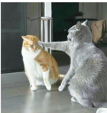
让你知道谁是老大