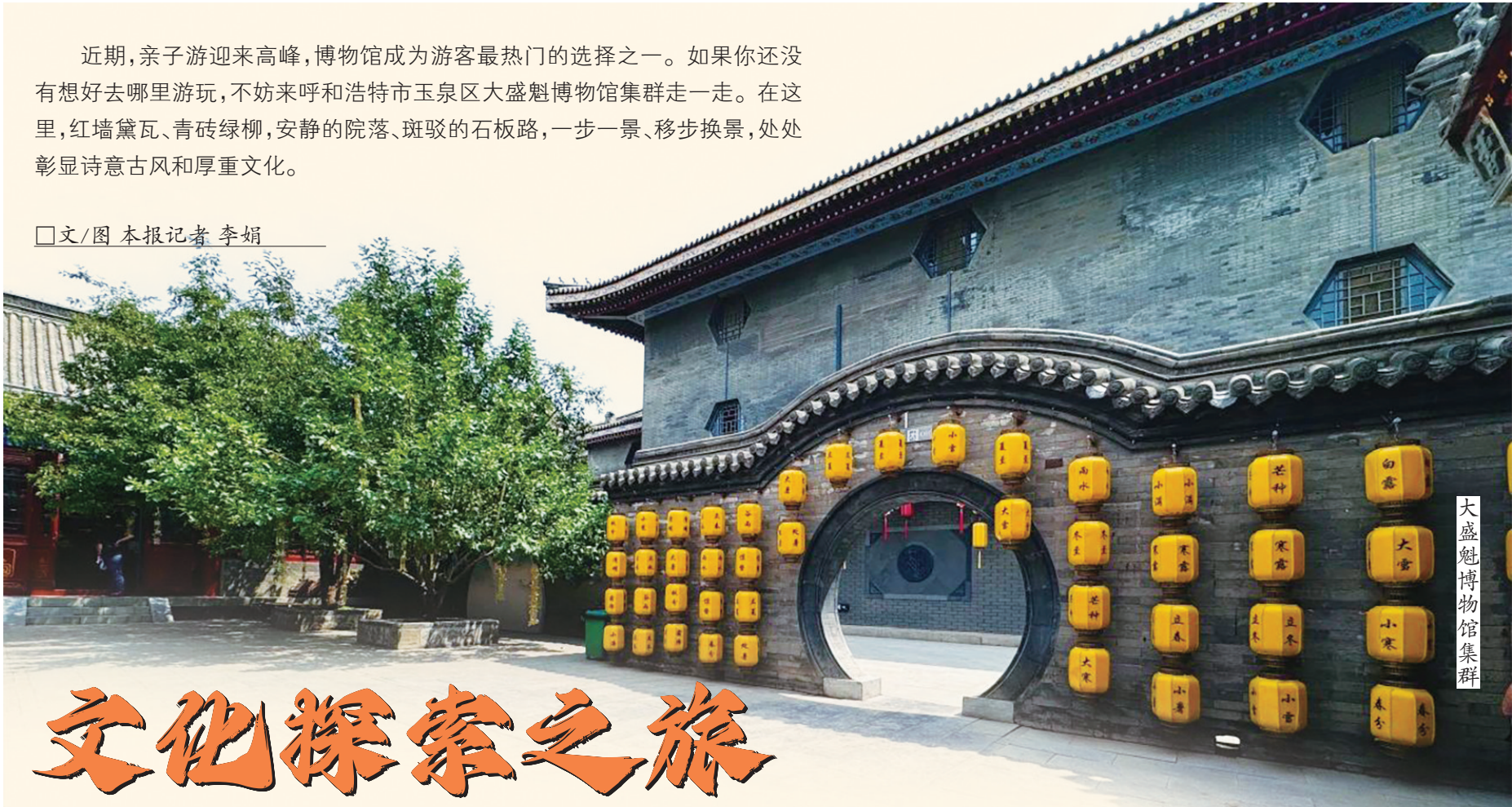
大盛魁博物馆集群