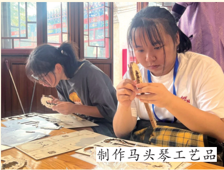
制作马头琴工艺品