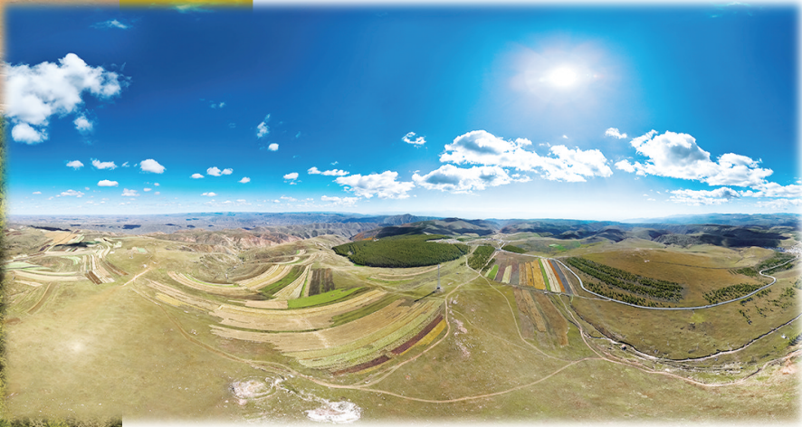
俯瞰东方麦谷景色