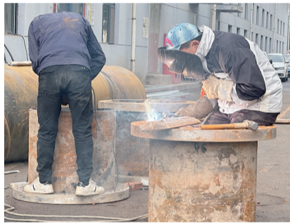
桥靠分公司大唐长输回水水泵站的施工点现场火花四溅

昨日上午,在赛罕区巨海城五区,工作人员发现小区庭院内有井盖“冒热气”的情况,检查后确定为庭院二次管网有漏水点,随后立即