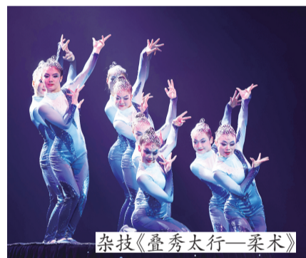
杂技《叠秀太行—柔术》