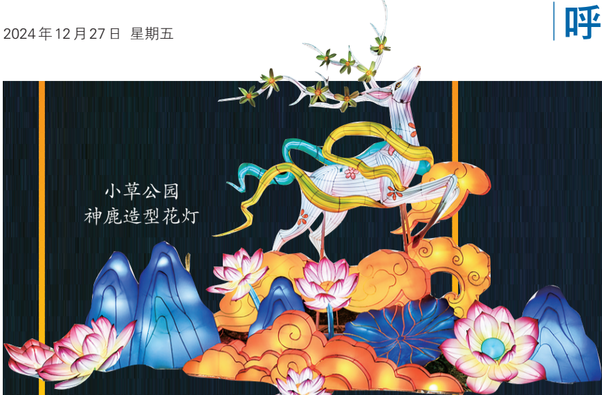
小草公园 神鹿造型花灯