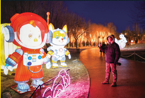
市民在小草公园拍摄卡通造型花灯

夜幕降临,华灯初上。漫步青城街头,树上悬挂的彩灯璀璨夺目,公园里精心制作的花灯造型独特,为这座美丽的城市平添几分节日的喜庆氛围。不少市民带着家人冒着严寒走出家门,只为欣赏这五彩斑斓的夜景。