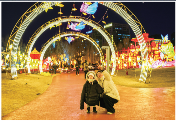
市民带着孩子在小草公园观赏花灯