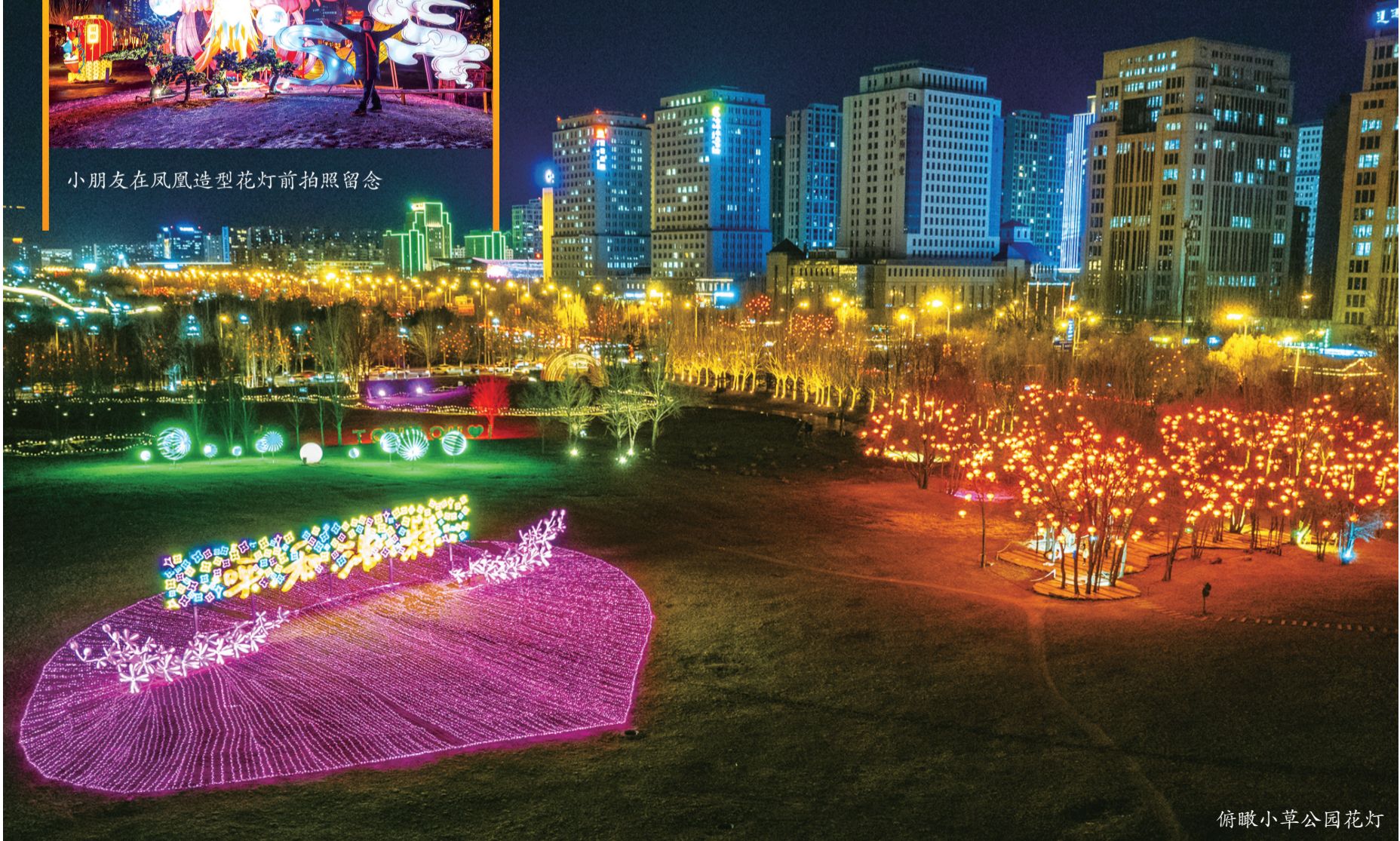
俯瞰小草公园花灯