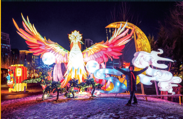
小朋友在凤凰造型花灯前拍照留念